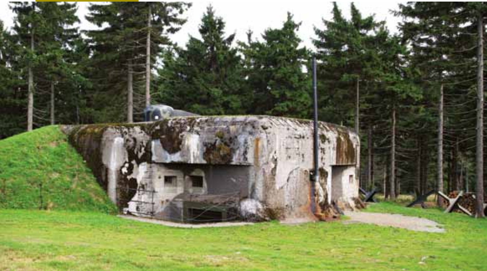
R-S 87 „Průsek“ v Orlických horách