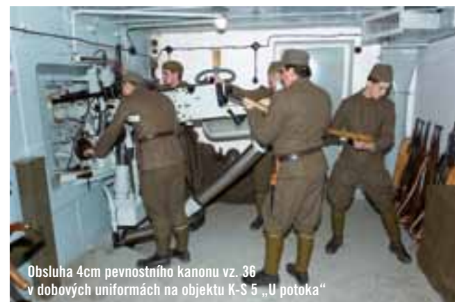
Obsluha 4cm pevnostního kanonu vz. 36 v dobových uniformách na objektu K-S 5 „U potoka“

Z důvodu co nejmenší zasažitelnosti a pozorování opevnění nepřítelům byly tyto objekty co nejvíc uzpůsobeny terénu a s různými úhly os hlavních zbraní, takže se dá říci, že každý z těchto objektů je originálem. Tyto objekty byly až na několik málo výjimek dvoupatrové (nadzemní bojové a podzemní pro umístění technického zabezpečení, jako byla strojovna, filtrovna, studna, WC, ubikace mužstva) a nejčastěji ve II. třídě odolnosti, což představovalo například čelní stěnu (k nepříteli) silnou 225 centimetrů,