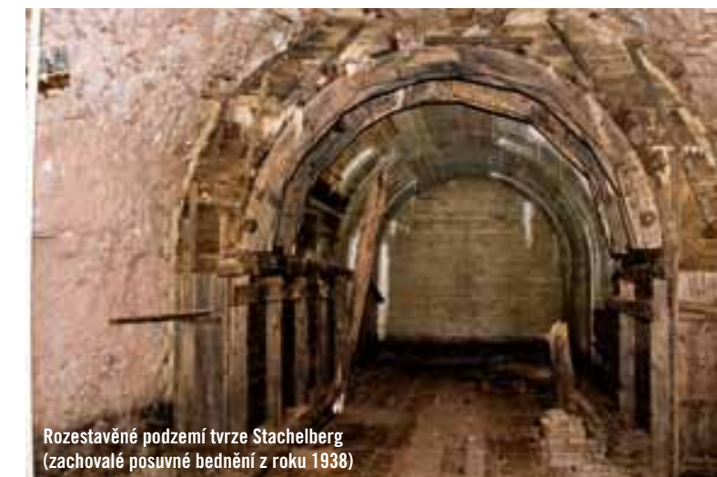
Rozestavěné podzemí tvrže Stachelberg (zachovalé posuvné bednění z roku 1938)

Přímo areálem muzea Stachelberg prochází cyklotrasa č. 4210, v mapách SHOCartu též nazývaná K Bunkrům.