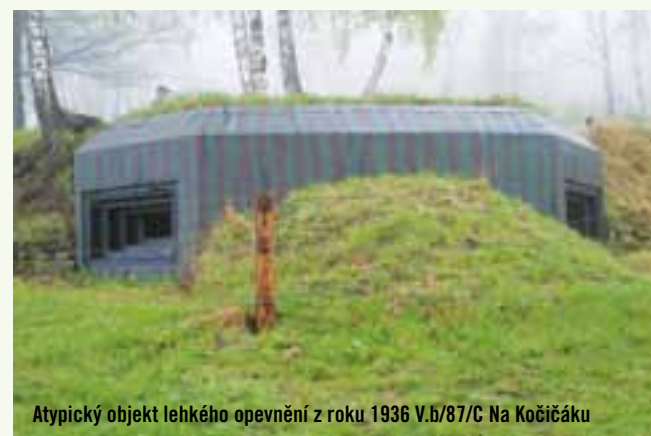
Atypický objekt lehkého opevnění z roku 1936 V.b/87/C Na Kočičáku