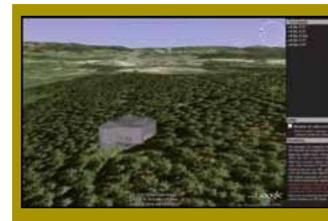
Modely 3D tvrže Bouda, v popředí K-Ba-S 24 „Libuše“, zasazeny do Google Earth

Ale existují i stránky věnované lehkému opevnění, lidově „řopíkům“. Nejpracovitějšími a nejobsáhlejšími stránkami s těmito objekty jsou www.ropiky.net , ty vás seznámí s různými typy těchto menších staveb čs. opevnění. Zjistíte na nich, že existují různé oblasti a úseky, které mají své označení, a že každý objekt má své jedinečné číslo. Databáze LO je celkem rozsáhlá, aby ne, když těchto objektů bylo v tehdejší republice (pozn. autora: myšleno i s Podkarpatskou