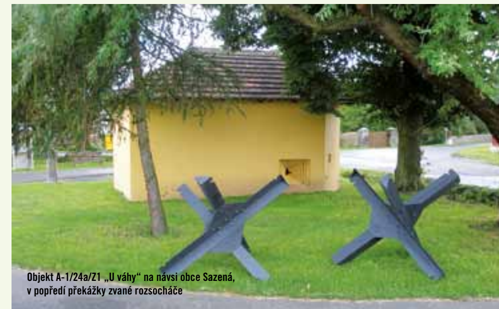
Objekt A-1/24a/Z1 „U váhy“ na návsi obce Sazená, v popředí překážky zvané rozsocháče

Na nejbližší cyklotrasy je okolí Sazené bohužel „hluché“. Ale když ve Veltrusech odbočíte z cyklotrasy č. 2 na sever do Nové Vsi, kde se potom dáte po silnici třetí třídy na Velvary, po 1,5 kilometrech dojedete do Sazené a tam už na návsi uvidíte místní váhu. Muzeum má i svoji dřevěnou turistickou známku č. 1610.