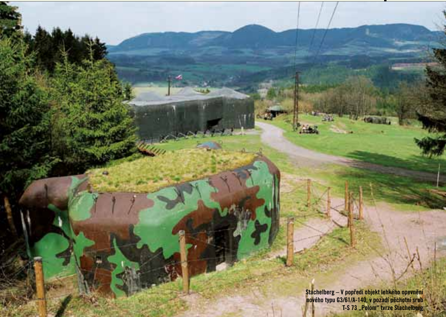
Stachelberg – V popředí objekt lehkého opevnění nového typu G3/61/A-140, v pozadí pěchotní srub T-S 73 „Polom“ tvrže Stachelberg