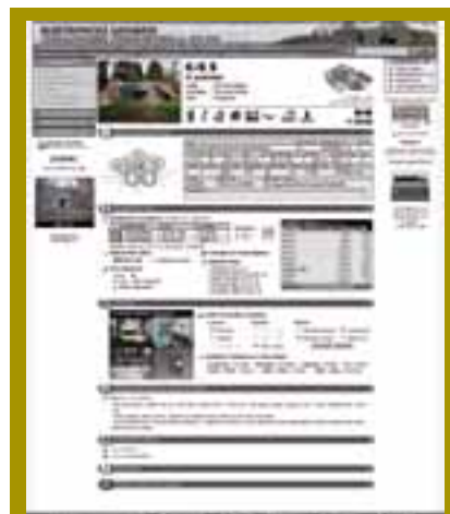
Je neuvěřitelné, kolik informací se dá najít k jednomu objektu ( www.opevneni.cz )

Pro vás, kteří jste tyto objekty v pohraničí, ale často také i ve vnitrozemí, potkali poprvé a zajímá vás, proč tenhle je takový a tamten je jiný, menší, bych doporučil navštívit například webovky www.bunkry.cz . Díky těmto stránkám zjistíte, že existuje opevnění těžké (TO) a lehké (LO), že objekty byly osazeny různými zbraněmi, měly kolem sebe také nějaké překážky, proč je jich po lese tolik apod. Další předností těchto stránek je jejich úžasný fotoarchiv, kde jsou umístěny často unikátní dobové fotografie,