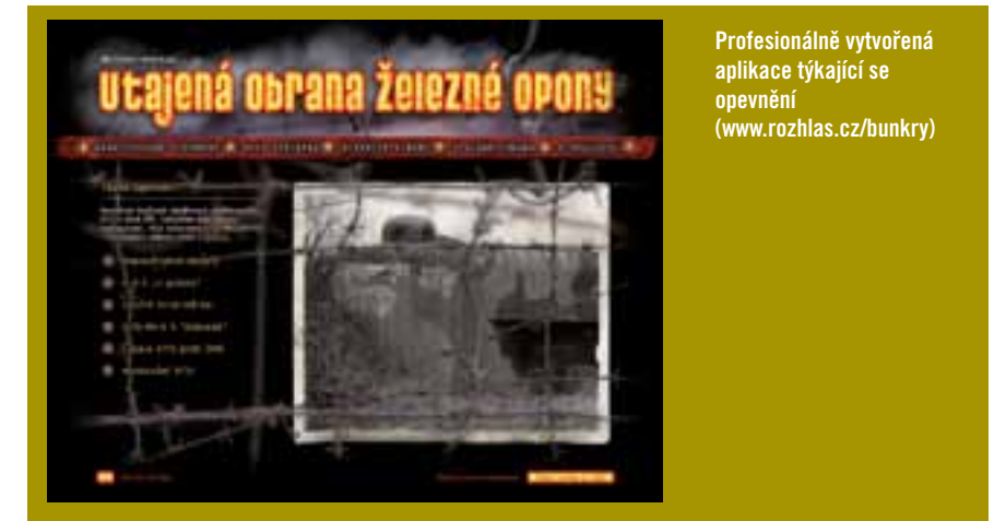
Profesionálně vytvořená aplikace týkající se opevnění ( www.rozhlas.cz/bunkry )

Takže až teď pojedete našimi lesy, luhy a háji, budete už díky těmto webovým tipům seznámeni s historií výstavby čs. opevnění a určitě stojí za to si při průjezdu kolem nich vzpomenout na ty, kteří chtěli bránit svoji vlast a podíleli se buď výstavbou, nebo ochotou položit svůj život při její obraně. Některé z nich vám ještě přiblížíme v navazujících výletních cílech.