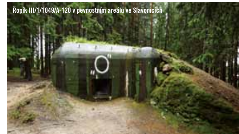
Řopík III/1/1049/A-120 v pevnostním areálu ve Slavonicích

Provozní doba je od května do září o víkendech, výjimkou je červenec a srpen, kdy je otevřeno denně od 10 do 17 hodin. Zájemci o prohlídku mimo tuto dobu mohou oslovit provozovatele na telefonu 606 124 829 nebo 774 640 750. Kompletní informace k provozu a pořádaným akcím v areálu najdete na www.slavonicebunkry.cz .